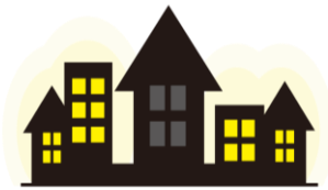
夜になっても明かりがつかない、 一晩中電気がつけっぱなし