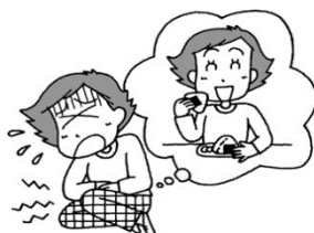
福祉委員の活動中、食べた弁当で福祉委員が食中毒になった