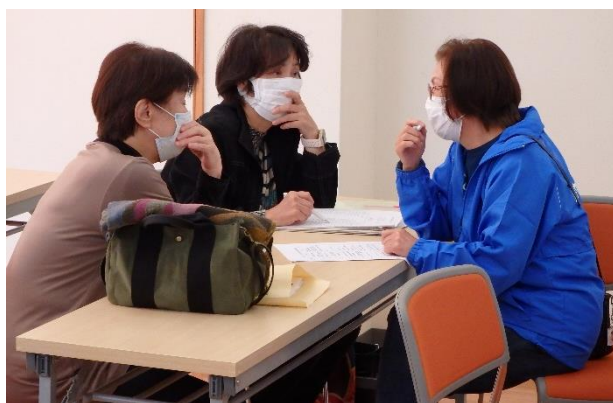
▲地区社協研修会で民生委員・福祉委員で情報共有