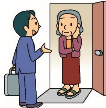
見慣れない人が 家に入り出しているようだ