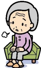
ご近所づきあいが少なく 孤立気味