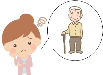
最近、外出している姿を 見かけなくなった