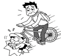
自転車で福祉委員の活動に向かう途中、他人にケガをさせた

※故意又は重大な過失、その他保険会社が規定する内容により、補償の対象外または保険金の減額となる場合があります。