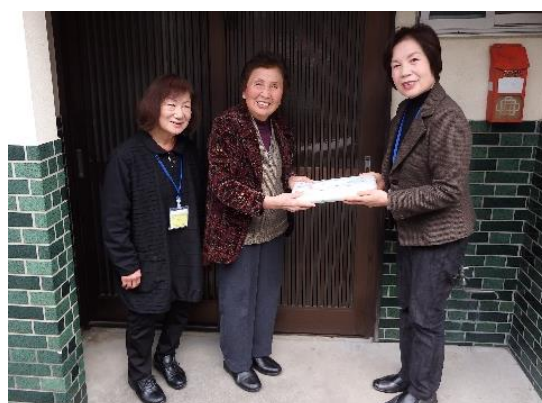
▲地区社協の取り組みで見守り訪問活動（民生委員・福祉委員）