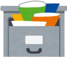
郵便物や新聞が 郵便受けにたまっている