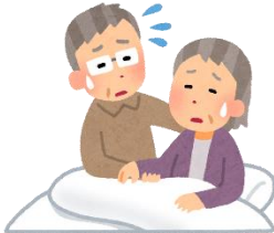
家族の介護に悩んでいる 様子だ