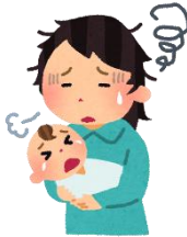
子育てに悩んでいる 様子だ

ポイント ...日常の世間話や生活状況の変化に「福祉課題（困りごと）」が潜んでいることがあります。まずは「ちょっとした変化」に気づくことが大切な役割となります。