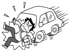
福祉委員の活動に向かう途中、交通事故に遭った