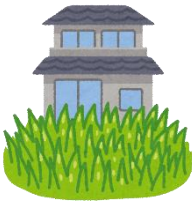
庭の手入れが されなくなっている